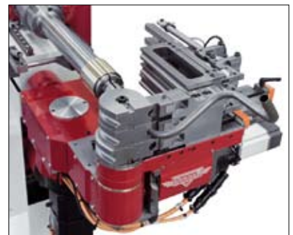
Herber 75/150 S with extra equipment for free programmable automatic tool change and free radius bending.