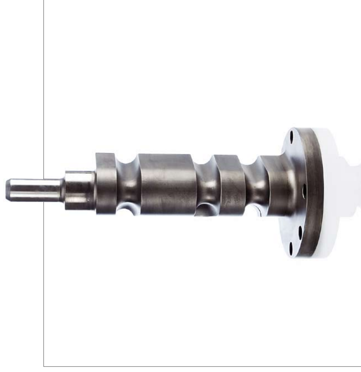
Herber Tube Bending Guide

■ No mandrel/ingen stöm Big mandrel/stor stöm Flexible ball mandrel (the figure indicates the recommended number of balls) /Långdom kulor i klotform Small mandrel/liten stöm